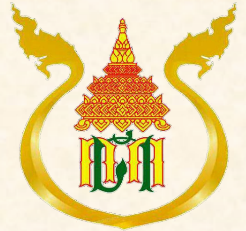
ด้านศุลกากรหนองคาย